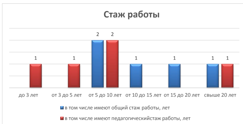
Диаграмма с характеристиками кадрового состава детского сада