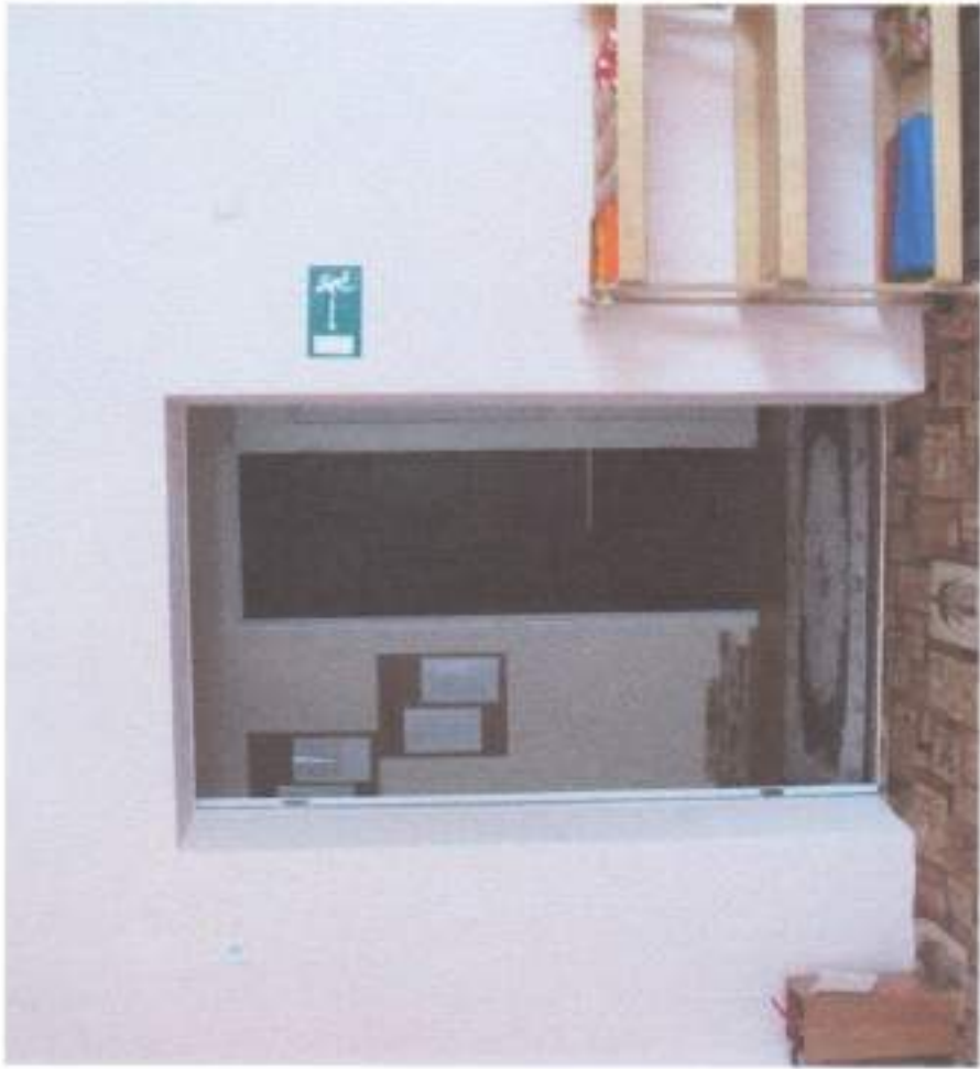
PHC ' 9